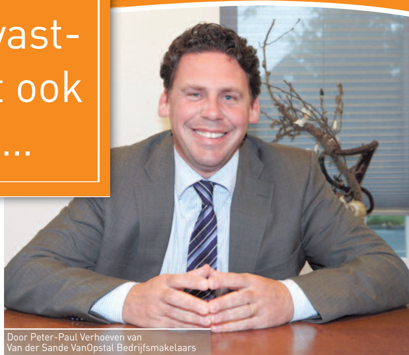
Door Peter-Paul Verhoeven van Van der Sande VanOpstal Bedrijfsmakelaars

Het voordeel is met name te vinden bij gebieden die voorlopig niet tot ontwikkeling kunnen komen en waar gebouwen liggen die nog bruikbaar zijn.